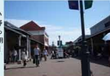
【佐野アウトレット】

棚澤 息子が実家に帰ってきていたので、息子の運転で佐野のアウトレットに連れて行ってもらいました。高速を利用して行くにあつという間に到着。店内はどれもとても安かったです。息子にトレーナーを1着買って貰って感激しました。