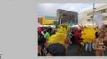
毎年恒例のサンバカーニバル