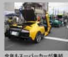
今年もスーパーカーが集結