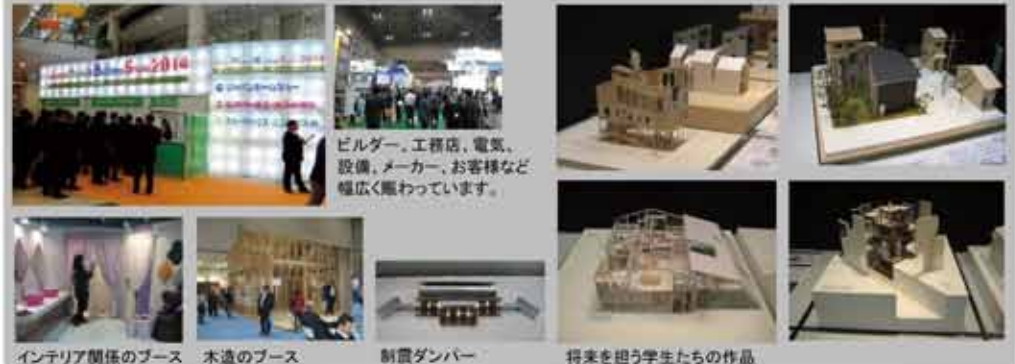
インテリア関係のブース 木造のブース 制震ダンパー 将来を担う学生たちの作品